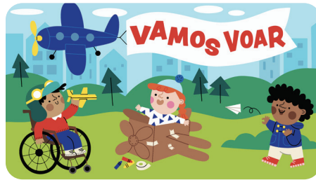
FEVEREIRO Vamos Voar