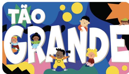
NOVEMBRO Tão Grande