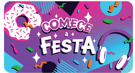
JUNHO Comece a Festa