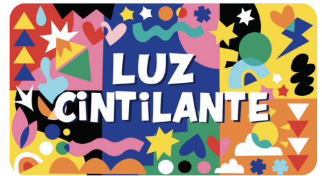
MARÇO Luz Cintilante