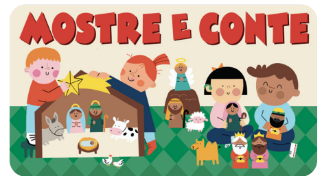
DEZEMBRO Mostre e Conte