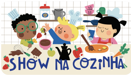
JANEIRO Show na Cozinha