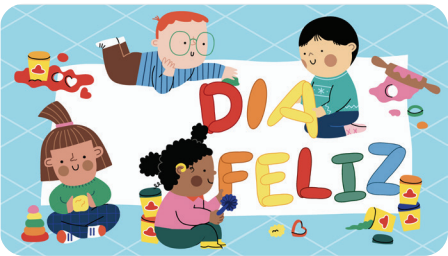
ABRIL Dia Feliz