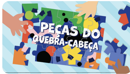
MAIO Peças do Quebra-cabeça