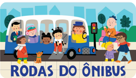
OUTUBRO Rodas do Ônibus