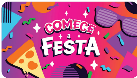
JULHO Comece a Festa