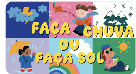
SETEMBRO Faça Chuva ou Faça Sol