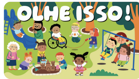
AGOSTO Olhe Isso!